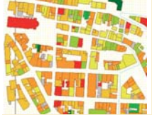
Format de restitution aux habitants : Cadastre colorié au format DPE

L'un des outils retenus par de nombreuses collectivités est la thermographie aérienne. En effet cette technique permet de survoler plusieurs habitations en même temps à l'aide d'une caméra infrarouge. Ainsi, sur un cliché d'environ 150 m de côté, il est possible de visualiser l'état thermique de plusieurs toitures en même temps.