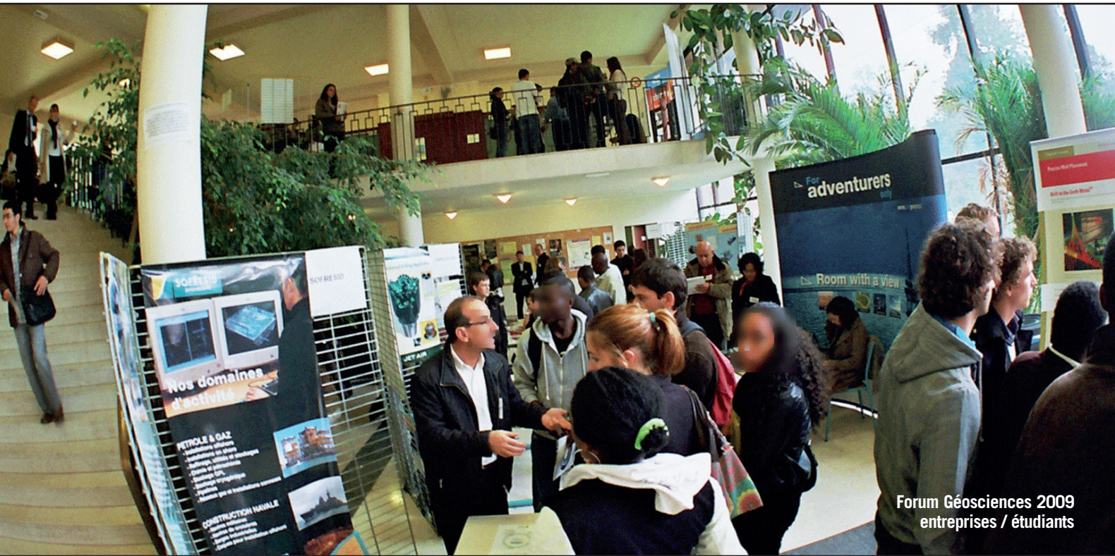
Forum Géosciences 2009 entreprises / étudiants