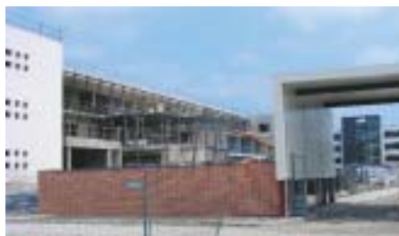
La future entrée d'HélioParc en travaux avec l'IPREM à gauche

Nouvelle entrée, nouvelle voie d'accès, nouveau poste de garde et d'accueil, nouvel immeuble de bureaux de 1500 m 2 , construction de l'IPREM, l'Institut Pluridisciplinaire de Recherche en Environnement et Matériaux, d'une superficie de 5100 m 2 , rénovation et agrandissement des cuisines qui pourront produire jusqu'à 300 repas/jour, programme de grosses répara-